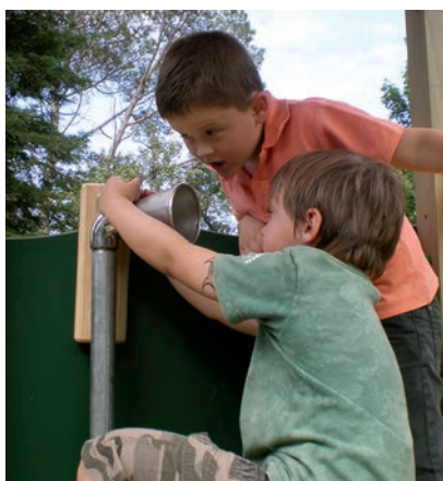
JUEGO TELÉFONO TELEPHONE GAME JEU TÉLÉPHONE