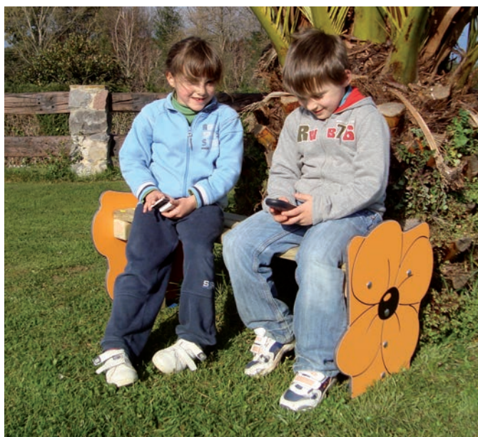
Banco JARA JARA bench Banc JARA Banco JARA